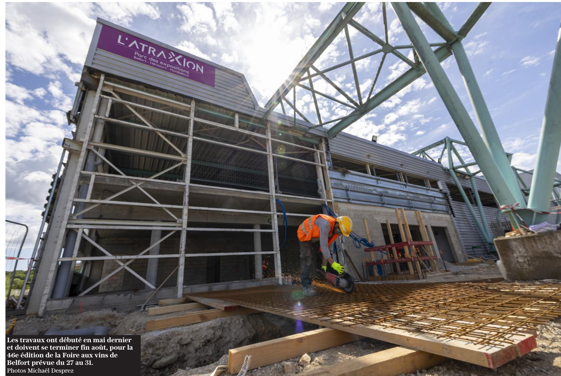
Les travaux ont débuté en mai dernier et doivent se terminer fin août, pour la 46 e édition de la Foire aux vins de Belfort prévue du 27 au 31.

Fin août, 2,4 millions d'euros auront déjà été dépensés. En 2027, la création d'une nouvelle façade avec une extension, la construction d'un espace événementiel et la réfection ainsi