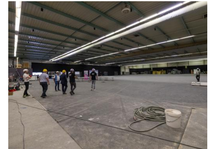
Le hall d'exposition de 3 200 m 2 du parc des expositions fait lui aussi l'objet de travaux, notamment de mises en conformité et accessibilité.