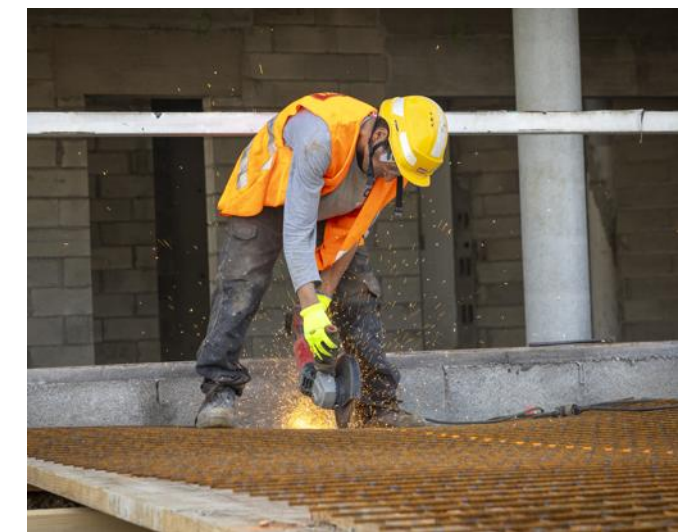
L'heure est notamment au gros œuvre en ce moment.